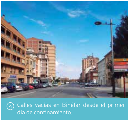
Calles vacías en Binéfar desde el primer día de confinamiento.

El Ayuntamiento de Binéfar desde el primer momento, tras la declaración del estado de alarma, tomó medidas para salvaguardar a sus ciudadanos del contagio del coronavirus (Covid-19). Dichas medidas se han ido modulando, siguiendo las normas generales dictadas por las autoridades competentes, para adaptarlas a las diferentes fases de la excepcional situación y al confinamiento total decretado finalmente por el Gobierno de España. En términos generales, los binefarense están observando con gran disciplina las duras normas del confinamiento, que al cierre de esta edición entraba en su cuarta semana, sin fecha todavía para la suspensión del estado de alarma.