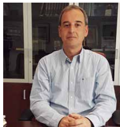
Alfonso Adán, alcalde de Binéfar.

Dentro de las potestades que nos permiten las normativas, ya estamos preparando un Plan de Acción Económico, para empresarios, comercio y vecinos para, con el objetivo de analizar la situación y ver cómo apoyarles donde sea posible, para intentar mitigar esas pérdidas que han tenido, y que el relanzamiento de la actividad les sea mucho más fácil con el apoyo de la administración, desde la local hasta la nacional. Intentaremos conjugar las iniciativas nacionales y autonómicas con las locales, para optimizar los recursos y maximizarlos para que lleguen a los más necesitados sobre todo. Se están teniendo reuniones con los grupos municipales para la creación de este Plan de Acción y en función de las afecciones, si son tasas o impuestos, deberán ir a través de una modificación de ordenanzas, no es de una manera inmediata pero sí retroactiva dentro de las posibilidades. Estamos trabajando para poder sacarlo lo antes posible, pero dentro de nuestro marco normativo.