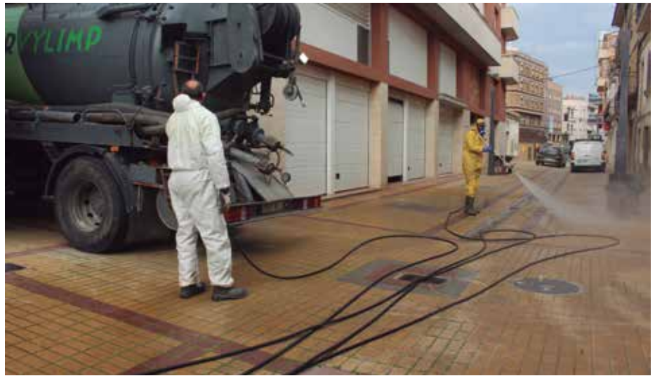
Una de las empresas contratadas, realizando labores de desinfección.