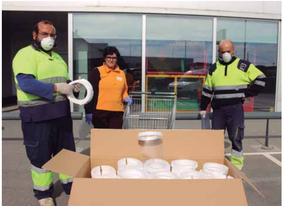
⤴ Miembros de la brigada municipal repartieron el material.

El Ayuntamiento de Binéfar igualmente proporcionó este material de protección (mascarillas, guantes y máscaras protectoras) del que se hizo acopio entre los sectores con más riesgo, como servicios esenciales y establecimientos que permanecen abiertos al público. Gracias a todos los que han colaborado, cada uno según sus posibilidades.